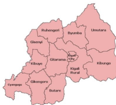
Provinciale indeling tot 2006